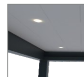
Oświetlenie LED - punktowe