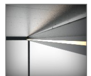
Oświetlenie LED - taśmowe, zintegrowane z rynną